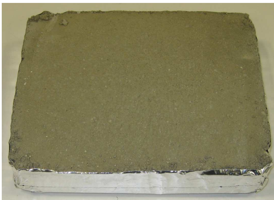
A001: Nanoestrich BASIC; Modell: CT-C35-F6 1:5

Hinweis: Die Untersuchungsergebnisse beziehen sich ausschließlich auf den vorgelegten Prüfgegenstand. Der Bericht verliert umgehend seine Gültigkeit bei Änderungen der Zusammensetzung oder des Produktionsverfahrens des Prüfgegenstandes. Eine vollständige oder auszugsweise Veröffentlichung des Prüfberichtes bedarf der Genehmigung.